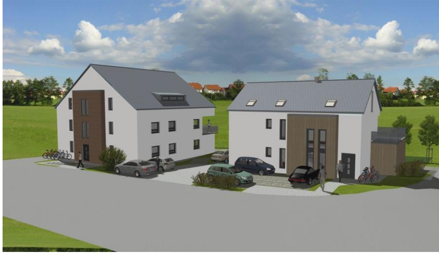
Blick von Goldwitzerstraße jpg