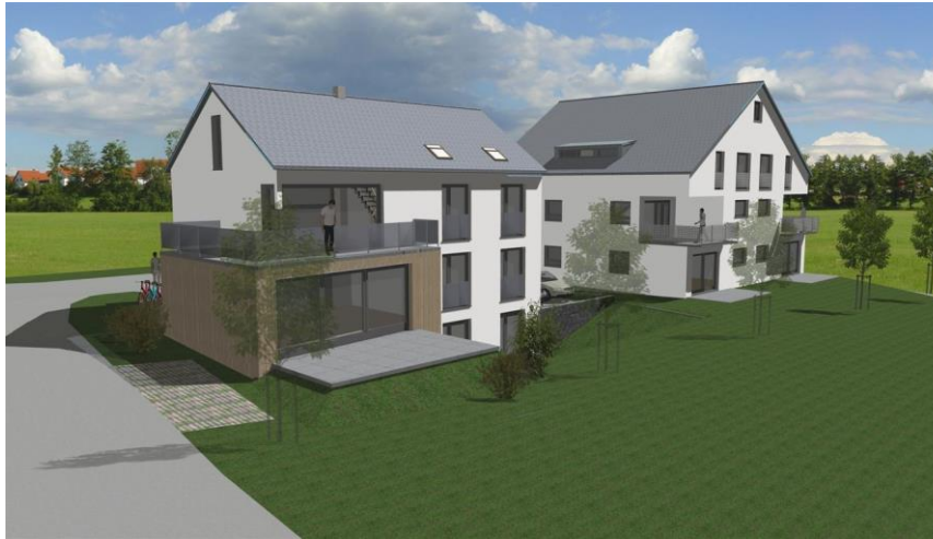
Blick von Kreuzstraße