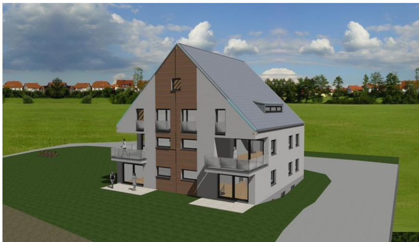
Haus mit 4 Whg Süd1