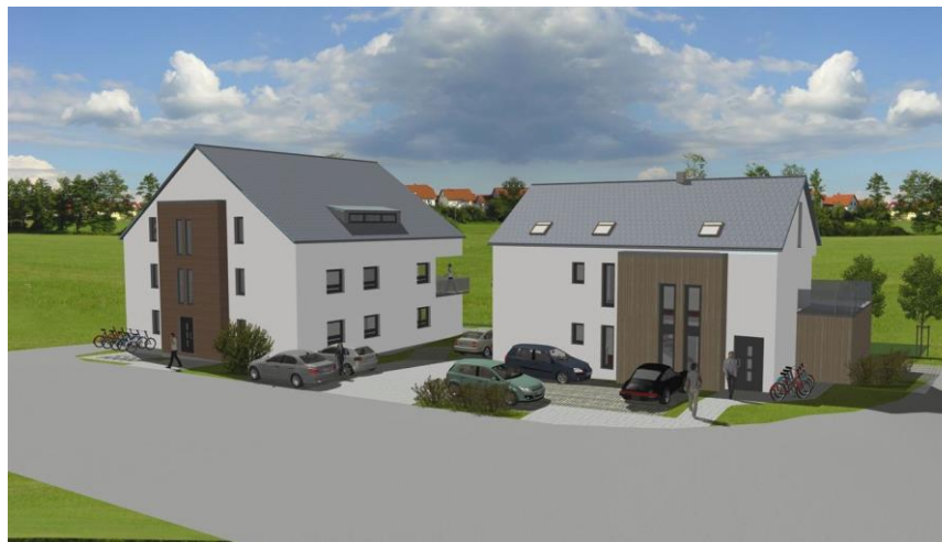
Blick von Goldwitzerstraße jpg