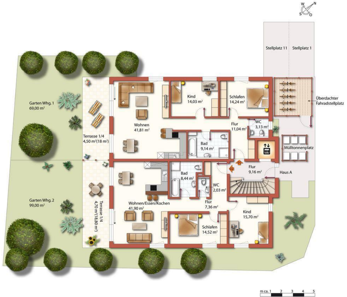
Whg.Nr. 1 u. 2