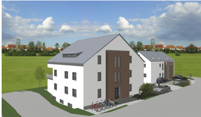
Blick von Goldwitzerstraße II